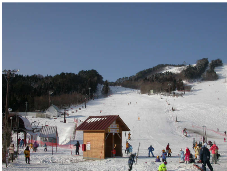
ちくさ高原開発企業組合